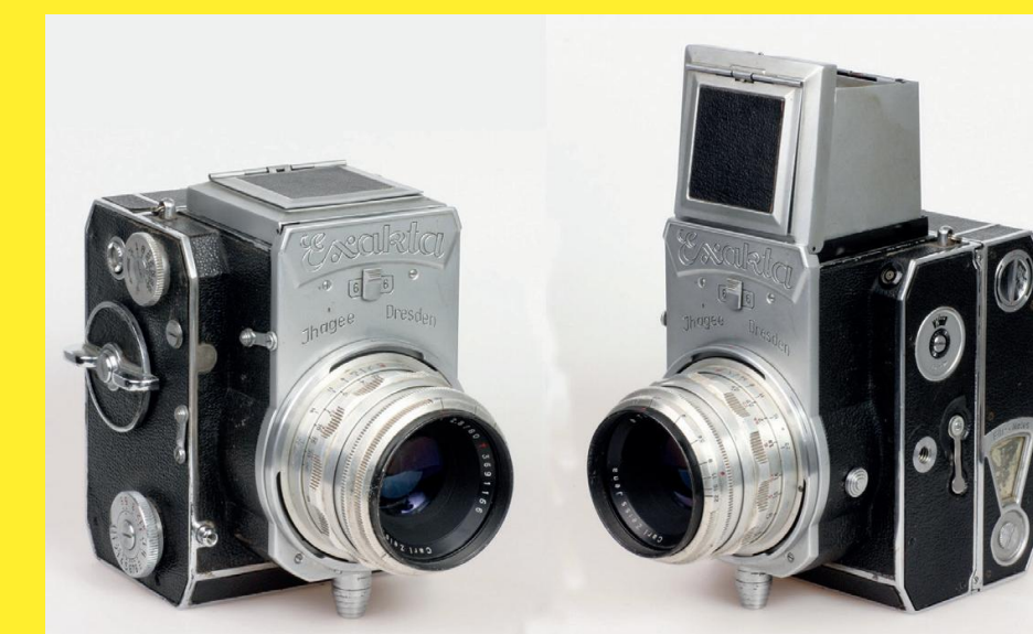
De Exakta 66 van 1953.

In 1953 werd opnieuw een Exakta voor het 6 x 6-formaat uitgebracht. Er zijn er zo weinig van over dat verzamelaars er nu veel voor over hebben. Sommige Amerikaanse verzamelaars vinden dit de mooiste Exakta ooit gemaakt!