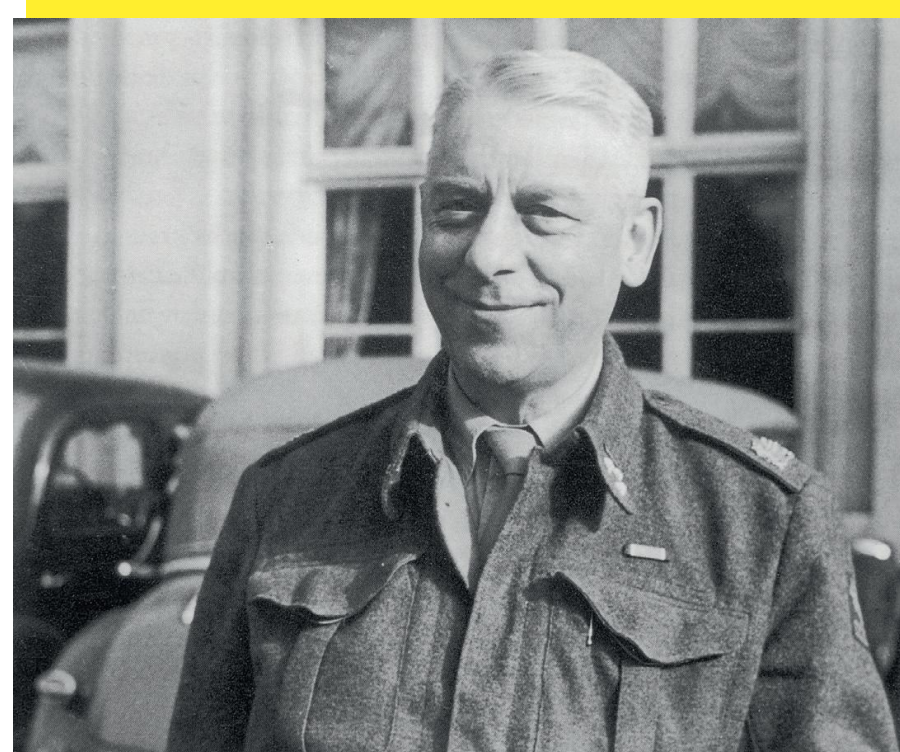
Kolonel Steenbergen in 1949.

Johan Steenbergen werkte van 1946 tot 1949 als kolonel bij de Nederlandse militaire missie in Duitsland, waar zijn goede contactuele eigenschappen en kennis van land en volk hem al gauw geliefd maakten.