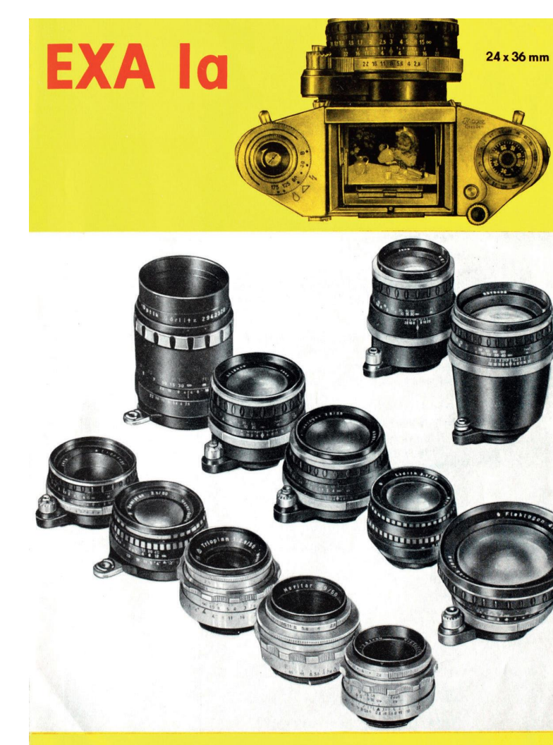
De EXA 1a met lenzen van Carl Zeiss Jena en Hugo Meyer Görlitz

Exakta's werden overal in de wetenschap, bij medische -, technische - en natuurfotografie en tijdens expedities toegepast, wat Ihagee tot grote bloei bracht. In de (klantgericht) marketing werden de gunstige ervaringen met Exakta's tijdens expedities in poolgebieden en woestijnen breed uitgemeten. Japanse en Europese lenzenfabrikanten maakten lenzen van 20 mm tot 1000 mm met de Exakta-vatting, waardoor de gebruiker uit honderden verschillende lenzen kon kiezen.