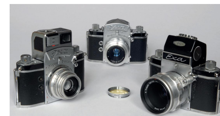
Drie versies van de eerste Exa. De Exa had dezelfde bajonet als de Exakta en kon ook dezelfde zoekers gebruiken.

In 1950 ontwikkelde Ihagee een klein zustermodel, de Exa, met dezelfde bajonetvatting als de Exakta. De Exa had een eenvoudiger ontwerp en was dus veel goedkoper. Hierdoor kwam de spiegelreflex binnen het bereik van een breed publiek. Van de Exa zijn er wereldwijd in verschillende versies miljoenen verkocht.