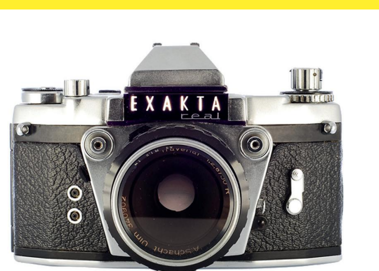
De in West-Duitsland geproduceerde Exakta Real werd geen succes.

Van de Sovjet-autoriteiten kreeg hij geen toestemming naar Dresden terug te keren. In een reeks processen in Europa en de VS probeerde hij - tevergeefs - zijn zeggenschap over Ihagee, de patenten en merkrechten terug te krijgen. Uiteindelijk richtte hij in 1959 in West-Duitsland Ihagee West op, dat de (nu zeldzame) Exakta Real ontwikkelde. Deze camera bleek evenwel technisch en commercieel een mislukking.