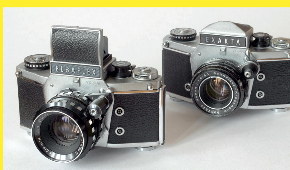
Exakta VX1000 naast de Elbaflex VX1000. In de loop van de jaren zestig verloor de Ihagee-fabriek in Dresden het recht om in Westerse landen de naam Exakta te voeren. Elbaflex was een alternatieve naam.

Na decennia in productie geweest te zijn zonder ingrijpende modelwijziging raakte het unieke geesteskind van Steenbergen en Nüchterlein in de jaren '60 technisch en commercieel achterop. Vooral de opkomende, innovatieve Japanse spiegelreflexcamera's met lichtmeting door de lens (een vooroorlogs patent van Karl Nüchterlein!) werden door hun kwaliteit, afwerking en prijs geduchte concurrenten. Door de rechtzaken van Johan Steenbergen om zijn fabriek terug te krijgen, verloor de fabriek in Dresden het recht om de naam Exakta te mogen voeren. Dezelfde cameramodellen werden geproduceerd onder andere namen. Soms werd de naam Exakta weggelaten. De Exakta VX1000 werd dan gewoon VX1000 genoemd. Een andere naam was Elbaflex.